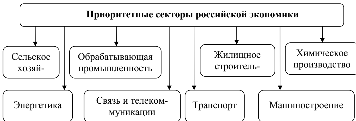
Рис. 1. Секторы российской экономики, приоритетные с позиции импортозамещения

Секторы экономики России, приоритетные с позиции импортозамещения представлены на рисунке 1.